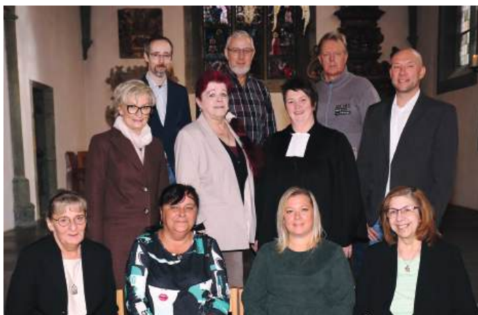
Silberne und Goldene Konfirmation