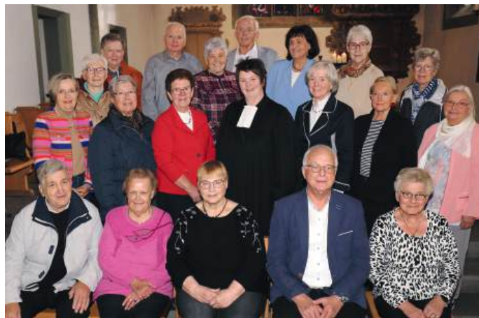
Diamantene Konfirmation