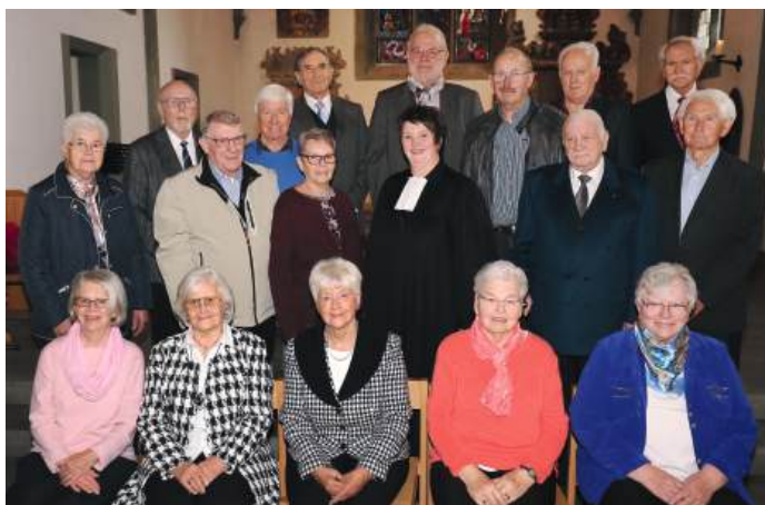
Eiserne Konfirmation