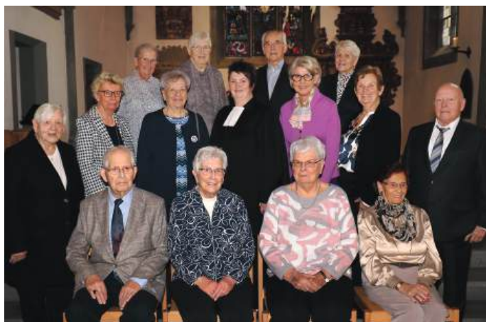
Gnaden und Kronjuwelen Konfirmation